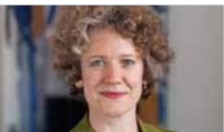
Corine Mauch, Stadtpräsidentin von Zürich

Dans le cadre de l'année de lutte européenne contre la pauvreté et l'exclusion sociale, la Confédération a tenu