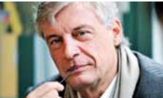
Manuel Tornare, Conseiller administratif de Genève

«Dans la prévention de la violence des jeunes, nous devons renforcer le travail en réseau, à tous les niveaux, cantonaux et fédéraux. Nous devons agir plus rapidement, tant au niveau préventif qu'au niveau répressif.»