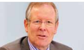
Ernst Zingg, Stadtpräsident von Olten

«Neu bei den Projets urbains sind der gesamtheitliche Ansatz von Migration bis Raumplanung, wie die Zusammenarbeit mehrerer Bundesämter zeigt, die Vernetzung von Gemeinden mit ähnlichen Problemstellungen und das gemeinsame Lernen auf verschiedenen staatlichen Ebenen.»