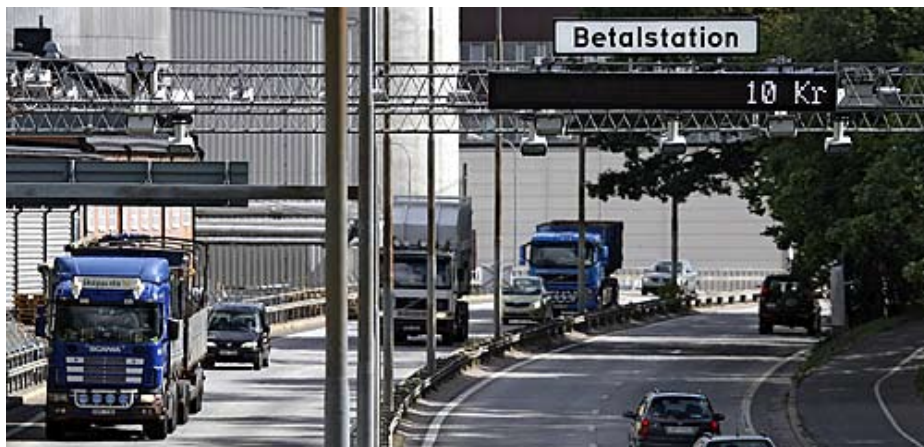
Road Pricing in Schweden