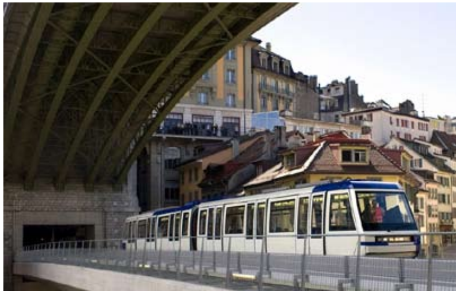
Le métro M2 de Lausanne, cofinancé par le Fonds d'infrastructure

Le FTP doit aussi couvrir les dépassements de crédits répétés pour la construction des NLFA. Ces surcoûts ont cependant pour effet de diminuer la manne à disposition des investissements ferroviaires sur le Plateau. Le Conseil fédéral a dès lors tenté de résoudre au moins les problèmes de financement les plus urgents avec son projet de Futur développement de l'infrastructure ferroviaire (ZEB). En l'état, les options dites d'extension pourtant indispensables (tunnels du Zimmerberg, du Wiesenberg, du Heiterberg et du