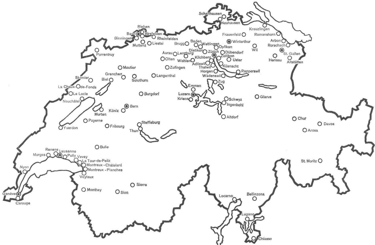
Die Verbandsstädte — Les membres de l'Union des villes suisses