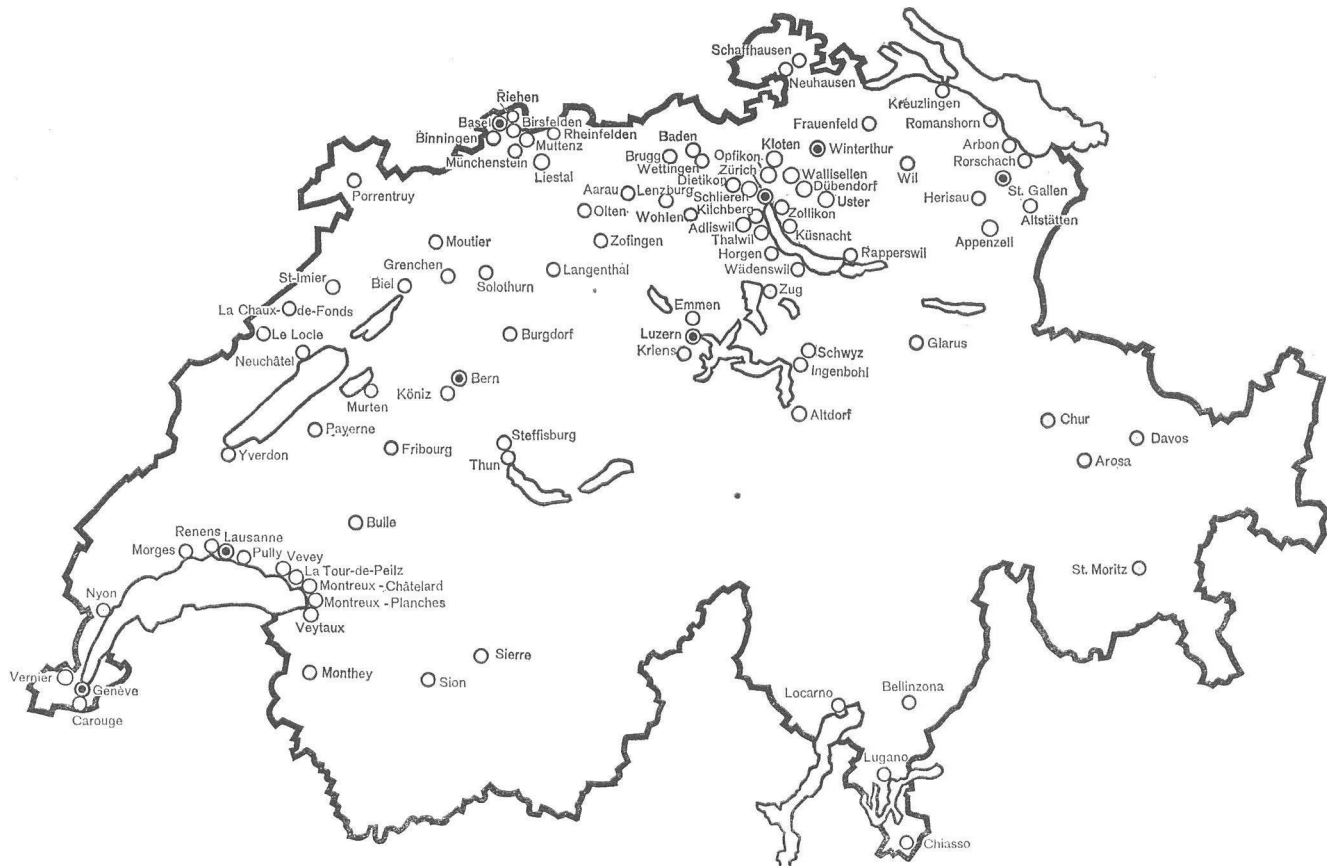
Die Verbandsstädte — Les membres de l'Union des villes suisses